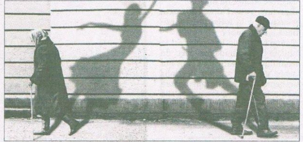
Le handicap et la vieillesse étaient abordés dans une chorégraphie dynamique.

Les thèmes du handicap et de la vieillesse ont été abordés à l'aide d'une chorégraphie dynamique, en n'excluant aucun domaine : la maison de retraite et l'isolement, le droit à la sexualité chez les personnes invalides, l'affectif chez les pensionnaires des établissements de fin de vie, le carcan d'un chariot... Les deux artistes ont voulu alerter sur notre société en théorie plus tolérante, mais qui met à l'index le handicapé et le vieux qui ne sont pas ou plus assez performants.