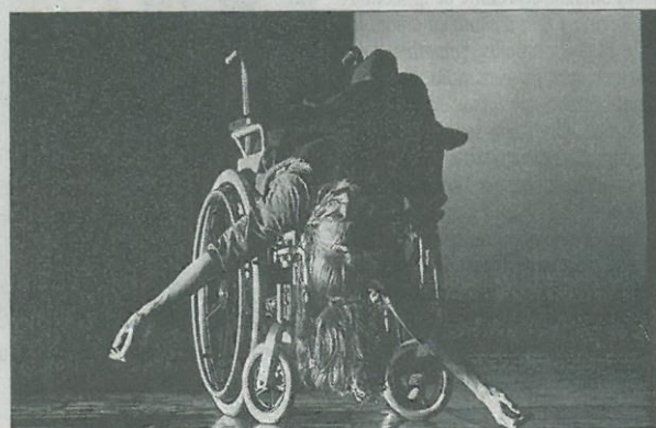
La première partie du spectacle Membo'o avait mis à l'honneur des personnes âgées.