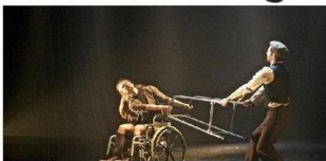
La pièce « Memb'oo' » de la compagnie Kalidjo.